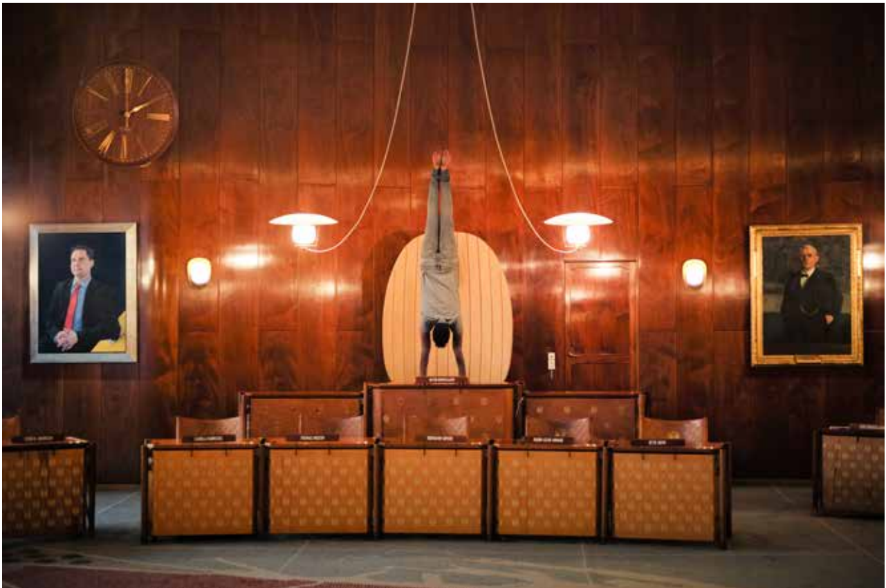
Mother Tongue , 2017 © Bonnie Elliott

On a pu la voir dans quantités de manifestations internationales (Palais de Tokyo, Kunsthalle de Tbilissi, Art Sonje Center de Séoul...) et de biennales (Istanbul, Sharjah) ces dernières années, dont à Venise en 2019 où elle a représenté l'Australie. Ses œuvres sont présentes dans les collections du monde entier.