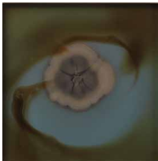
Cladosporium , 2016

Du dessin à la photographie, le travail de Dove Allouche ne se situe jamais complètement dans l'un ou l'autre. Il s'intéresse plutôt aux conditions d'apparition des images où le médium n'a de sens que dans sa relation mutuelle avec le sujet. Ses projets artistiques prennent souvent source dans le réel ou la manifestation de phénomènes naturels. De la série des Pétrographiques , qui proviennent de coupes stalagmitiques utilisées directement comme négatifs photographiques, à la série des Fungi , qui associe les moisissures présentes dans les réserves de musées à des verres soufflés spécifiques, la plupart de ses images mettent en tension une énergie quasi organique de la matière et l'idée d'une temporalité indéfiniment étirée qui lui permet de projeter dans le présent quelque chose qu'il recherche dans le passé.