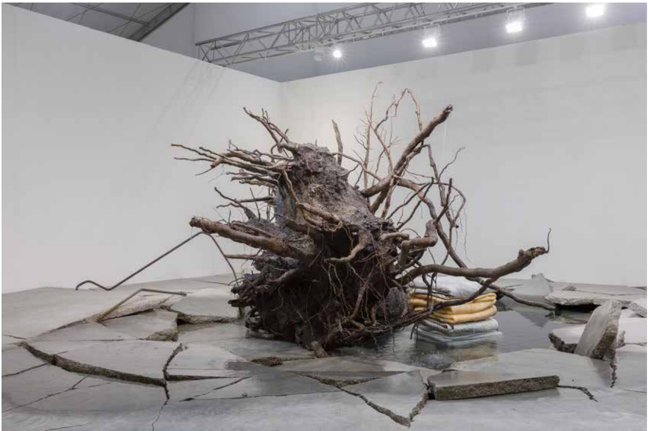
The Shaman , 2018

Les dessins, installations architecturées, les sculptures et objets de Tatiana Trouvé rejouent les coordonnées de l'espace et du temps sur des plans matériels et physiques autant que sur des plans psychiques. Les espaces domestiques se confondent avec des espaces naturels, le minéral croit et le vivant se fige, l'intérieur et l'extérieur deviennent indistincts, les deux dimensions du dessin se combinent aux trois dimensions du volume, les échelles et les rapports entre les choses sont altérés... Ainsi, les ordres et les lois qui définissent notre réalité sont recomposés dans des mondes où se formulent de nouvelles coexistences, où l'espace et le temps flottent, où nos repères perceptifs se déplacent, à l'origine d'une expérience de désorientation.