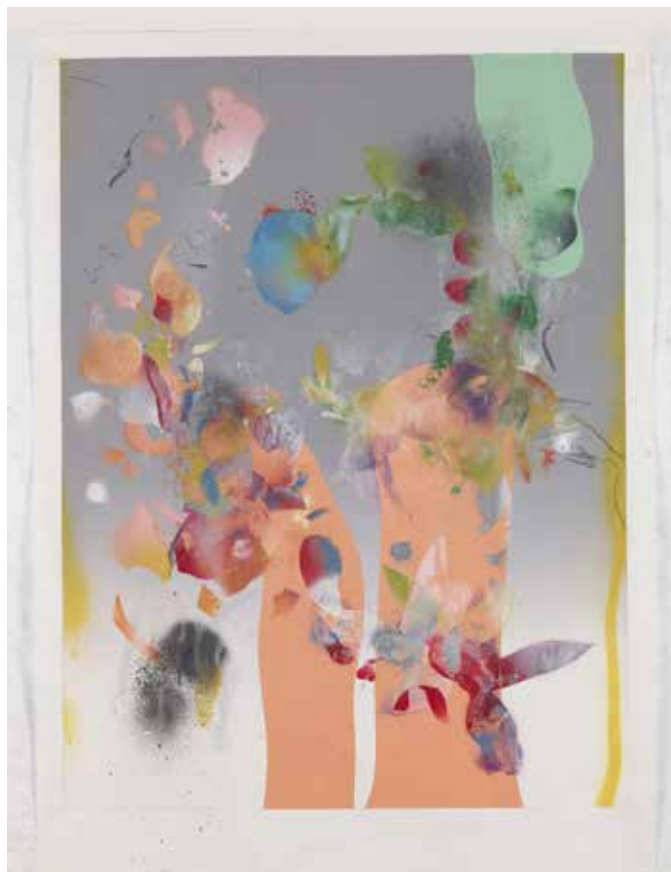
Sans titre, 2017 © Marc Damage

Formé aux Beaux-Arts de Nîmes puis à l'Institut des Hautes Études en Arts Plastiques, Stéphane Calais réalise régulièrement des wall paintings pour des institutions de par le monde. Il a par ailleurs dernièrement présenté une exposition personnelle au Palais de Tokyo (2016) et participe à la Biennale de Lyon 2019.