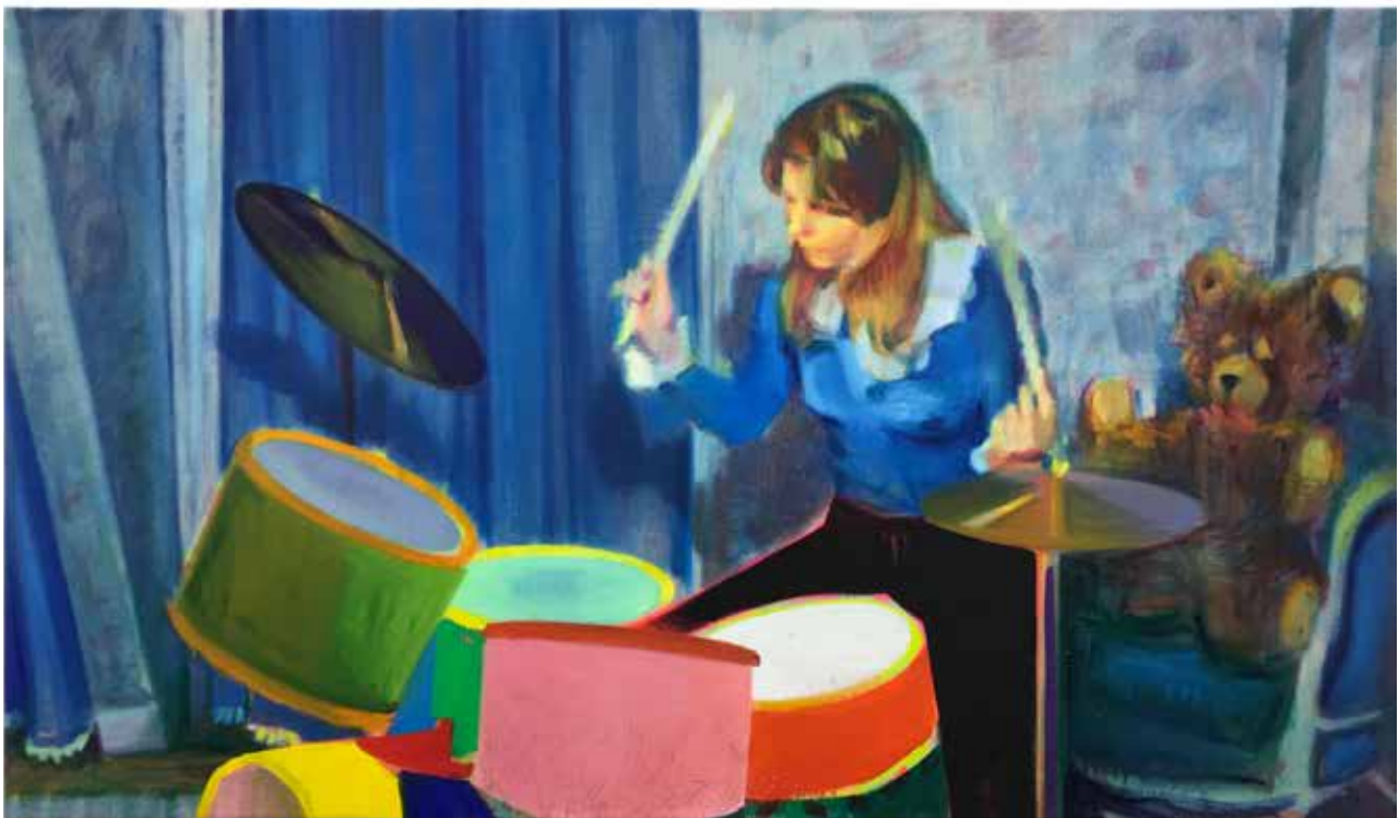
996-Karen nounours, 2018 © ADAGP, Paris 2019

Ses peintures énergétiques sont présentes dans de nombreuses institutions (CRAC à Sète, Le Parvis à Tarbes...) mais aussi dans les collections privées et publiques de France (Frac, FNAC...) et d'Europe (Fonds Cantonal de Genève...). Le Mamco (Musée d'Art Moderne et Contemporain) à Genève lui a notamment consacré une exposition personnelle d'envergure en 2009.