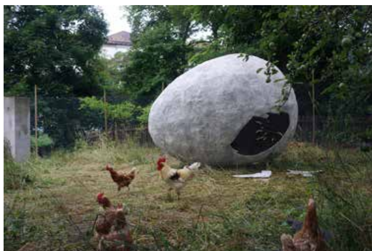
What comes first , 2015 © Petrit Halilaj & Alvaro Urbano

En 2014, à la Villa Romana à Florence, le duo a réalisé un passage long de 60 mètres pour leurs canaris et en 2015 à Salts Basel, le duo s'affirme en mettant en place une installation commune et à grande échelle dans laquelle des poules élisent domicile dans un œuf grand format. Cette volière géante complétée par de multiples ramifications signe le point de départ d'une collaboration où l'animal rencontre le politique et l'utopique. Leurs recherches se penchent sur la dichotomie entre l'environnement bâti et la nature, et sur les possibilités de négociation entre ces deux réalités : à cet égard, les habitants qui occupent ces espaces liminaux suscitent un intérêt particulier pour les deux artistes.