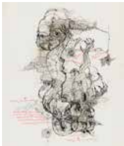
Unica Zürn

Paolo Veronese, Hans Baldung Grien, Jean-Baptiste Carpeaux, Pierre Alechinsky, Unica Zürn, Jean-Michel Alberola... les artistes présentés dans cette exposition abordent la question des relations entre texte et image. Par les inscriptions, le visiteur se trouve au cœur de la création et perçoit toutes les complexités d'une invention où se mêlent imagination, contraintes d'une commande, culture visuelle, mais aussi hasard et improvisations.