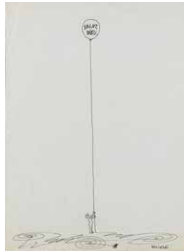
Salut, Dieu , 1967 Plume et encre de Chine

En 1965, Wolinski adopte ce qu'il qualifie de « nouveau style » : celui des croquis qu'il griffonne pendant les conférences de rédaction d' Hara-Kiri , et qui font la délectation de Cavanna. D'un grand dépouillement graphique, ils se caractérisent par un style épuré et synthétique qu'illustrent ses célèbres falaises. Les compositions se réduisent à une figure isolée accompagnée d'un texte concis, parfois même absent, dans un paysage minimaliste. Dépourvues de référence précise à un lieu ou une époque, elles recèlent, à la manière d'« aphorismes mi-philosophiques, mi-moralistes », des réflexions parfois métaphysiques que le lecteur est invité à deviner. Situations cocasses ou absurdes, images surréalistes de soleils jumeaux ou de pieds étreignant un homme, révèlent le regard léger et poétique, parfois mélancolique, porté par l'artiste sur l'existence.