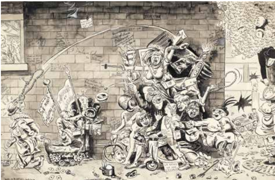
Allons enfants , 1965 Plume et lavis d'encre de Chine, graphite, crayon noir, feutre noir © Beaux-Arts de Paris

En 1965, Wolinski adopte ce qu'il qualifie de « nouveau style » : celui des croquis qu'il griffonne pendant les conférences de rédaction d' Hara-Kiri , et qui font la délectation de Cavanna. D'un grand dépouillement graphique, ils se caractérisent par un style épuré et synthétique qu'illustrent ses célèbres falaises. Les compositions se réduisent à une figure isolée accompagnée d'un texte concis, parfois même absent, dans un paysage minimaliste. Dépourvues de référence précise à un lieu ou une époque, elles recèlent, à la manière d'« aphorismes mi-philosophiques, mi-moralistes », des réflexions parfois métaphysiques que le lecteur est invité à deviner. Situations cocasses ou absurdes, images surréalistes de soleils jumeaux ou de pieds étreignant un homme, révèlent le regard léger et poétique, parfois mélancolique, porté par l'artiste sur l'existence.