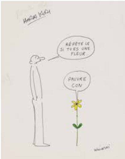
Répète le si t'es une fleur , 1969 Plume et encre de Chine, feutres vert et jaune © Beaux-Arts de Paris