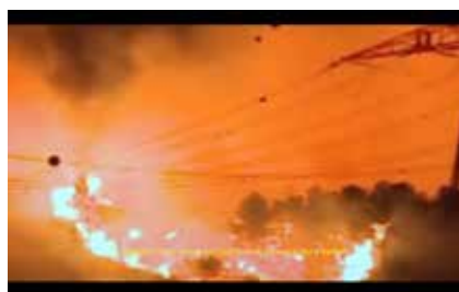
Jade Boudet, La Valentine , 2019 © Jade Boudet