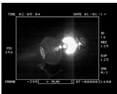
Ann Veronica Janssens, Slow Light , 2006 Captures de l'allumage d'une ampoule de 25 watts et d'un néon, prises à 1000 images/sec, 10 minutes 50 seconds (en boucle)