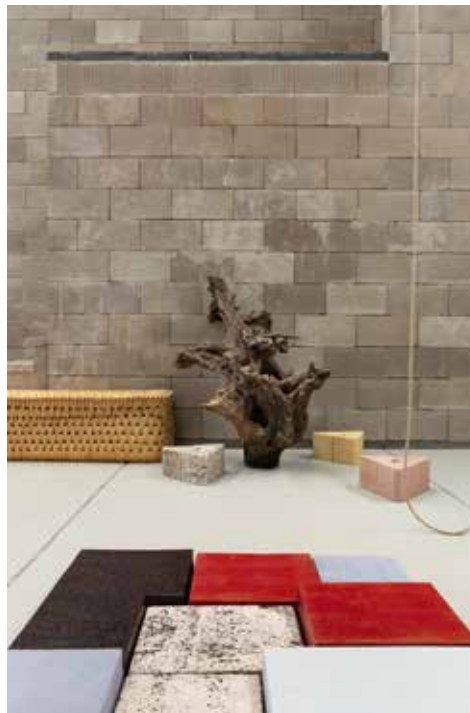
Vue de l'atelier de Leonor Antunes