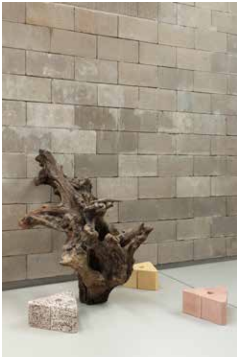
Vue de l'atelier de Leonor Antunes