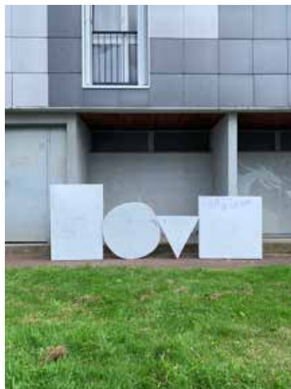
Andréas Fevrier, LOVE , œuvre interactive, 2020 Réactivation dans le cadre du Théâtre des expositions, 2021 © Andréas Fevrier