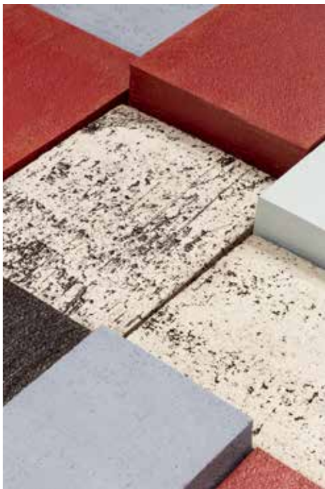
Leonor Antunes, Discrepancies with M.Y. Céramique, 140 x 95 x 8,5 cm

Jeudi 14 octobre à 17h - entretien avec Leonor Antunes mené par Alain Berland, responsable de la programmation culturelle, et Thierry Leviez, responsable des expositions aux Beaux-Arts de Paris.