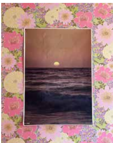
Céline Furet, Teen Spirit , 2020 © Céline Furet

Sur une proposition de Céline Furet, artiste commissaire résidente aux Beaux-Arts de Paris, en collaboration avec Arthur Dokhan, Morgane Ely, Nicole Mera, Molten_cOre (Lucas Hadjam et Baptiste Pérotin), Chalisée Naamani, Maëlle Poirier, Léa Scheldeman, Hélène Tchen & Laure-Anne Tchen, artistes invités.