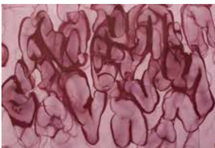
Gabriele Chiari, Aquarelle n°112 , 2018 aquarelle sur papier, 73 x 110 cm © Gabriele Chiari

Artistes présentés : Pierre Alferi, Marika Belle, Jérôme Boutterin, Gabriele Chiari, Camille Corréas, Marie de Brugerolle, Jordan Derrien, Louis Desbordes, Juliette Green, Airwan Groove, Ann Veronica Janssens, Romain Moncet, Romain Quattrina, Nicolas Quiriconi, Pauline Rima, Sophie Rogg, Alejandro Villabona