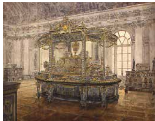
Maurice-Joseph Lucet, Une vitrine pour l'exposition d'objets précieux, Dessin scolaire d'architecture, Concours Rougevin, 1903 © Beaux-Arts de Paris