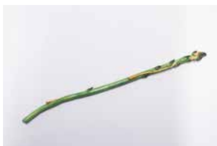
Camille Corréas, Asperges , 2021 Céramique émaillée, dimensions variables © Camille Corréas