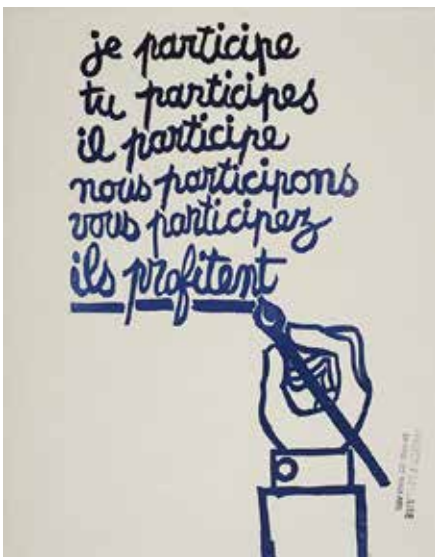
Atelier Populaire (Beaux-Arts de Paris), Affiche de mai 68, œuvre issue des collections de l'École