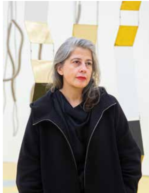
Portrait de Leonor Antunes