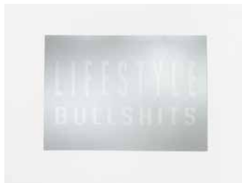
Pauline Rima, « LIFESTYLE BULLSHIT », 2021 Sérigraphie à paillettes sur papier argenté, 50 x 70 cm © Pauline Rima