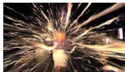
Jean-Charles Hue, Y'a plus d'os , 2006