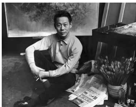
Zao Wou-Ki dans son atelier parisien en 1958