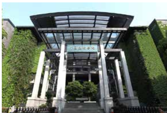
China Academy of Art de Hangzhou