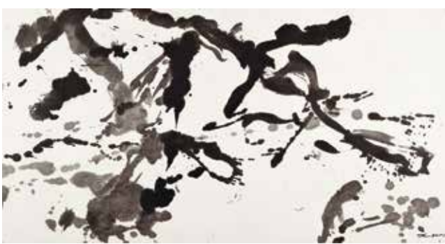
Sans titre , 2006 Encre de Chine sur papier, 97 x 187 cm Collection particulière © ProLitteris © Naomi Wenger