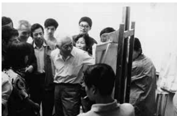
Zao Wou-Ki donnant ses cours à l'Ecole des beaux-arts de Hangzhou en 1985