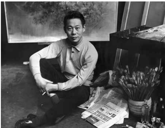
Zao Wou-Ki dans son atelier parisien en 1958

La Fondation Zao Wou-Ki s'engage avec les Beaux-Arts de Paris sur une période de deux ans pour faciliter la mobilité des étudiants et jeunes artistes français et chinois. Ce partenariat repose sur un soutien financier attribué à des étudiants effectuant leurs études aux Beaux-Arts de Paris ou à la China Academy of Art de Hangzhou, la plus grande école d'art chinoise, dans laquelle Zao Wou-Ki fut élève, puis enseignant.