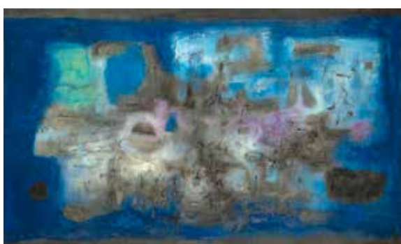
Ville engloutie , 1955 Huile sur toile, 89 x 146 cm Collection particulière