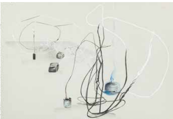
Tatiana Trouvé, Sans titre , 2017 Mine graphite, crayons de couleur, aquarelle et cuivre collé sur papier, 38 x 56,5 cm