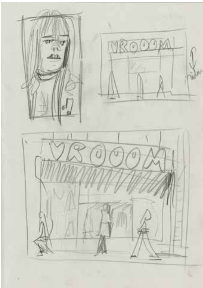
Nina Childress, page de carnet , 2022 Crayon sur papier, 29,7 x 21 cm