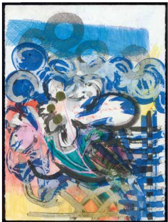
Frédérique Loutz, Lessiver, gribouiller , 2018 Technique mixte, 76,4 x 56,7 cm