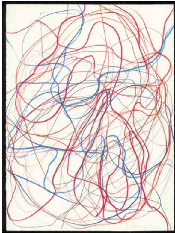
Giljan Gelzer, Sans titre , 2017 Graphite et crayons de couleur sur papier, 75,5 x 56 cm