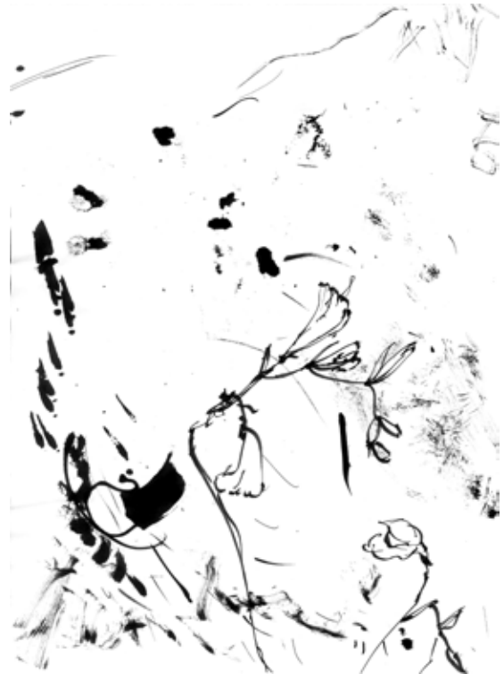
Stéphane Calais, Sans titre , 2020 Encre sur papier japonais, 34 x 24 cm