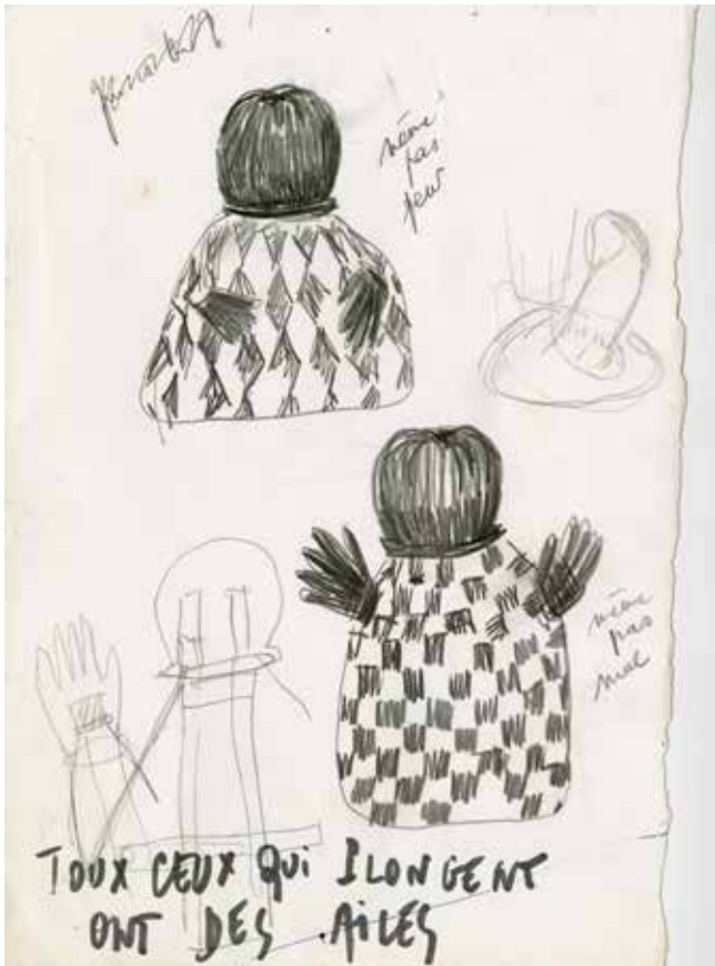
Anne Rochette, Tous ceux qui plongent ont des ailes , 2015 Graphite sur papier, 29,7 x 21 cm