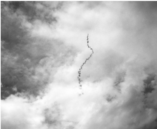
Hicham Berrada, Un serpent dans le ciel , 2008 Vidéo noir et blanc, 1'34" ; ballon 1 m 3 d'hélium, dispositif de balancier en laiton, fumigène artisanal, mèche