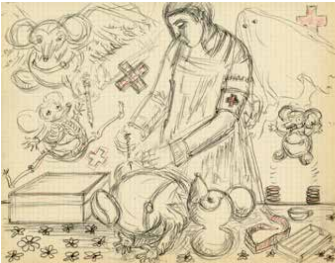
Valérie Sonnier, Sans titre , 2022 Pierre noire et crayons de couleur sur papier, 21 x 27 cm