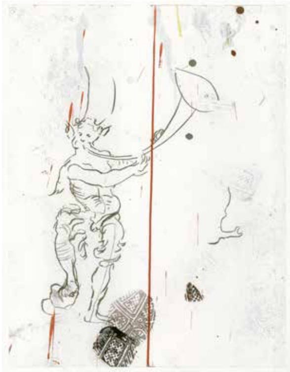
Hélène Delprat, Sans doute d'après Urs Graf , 2021 Fusain et traces de pas, coulure de peinture acrylique, ocre rouge