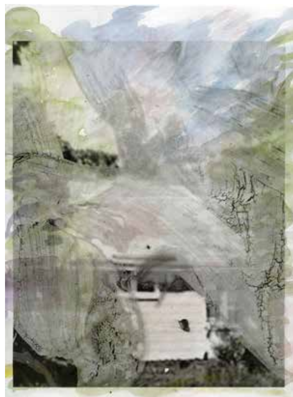
Eva Nielsen, Étude 1 , 2022 Aquarelle, encre et sérigraphie sur papier Canson, 29,7 x 21 cm