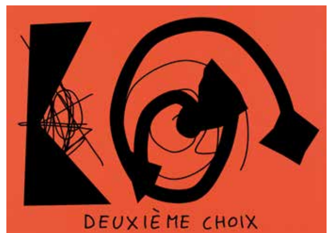
Claude Closky, Deuxième choix , 2020 Impression numérique sur papier 160g coloré, feutre gouache, 29,7 x 42 cm