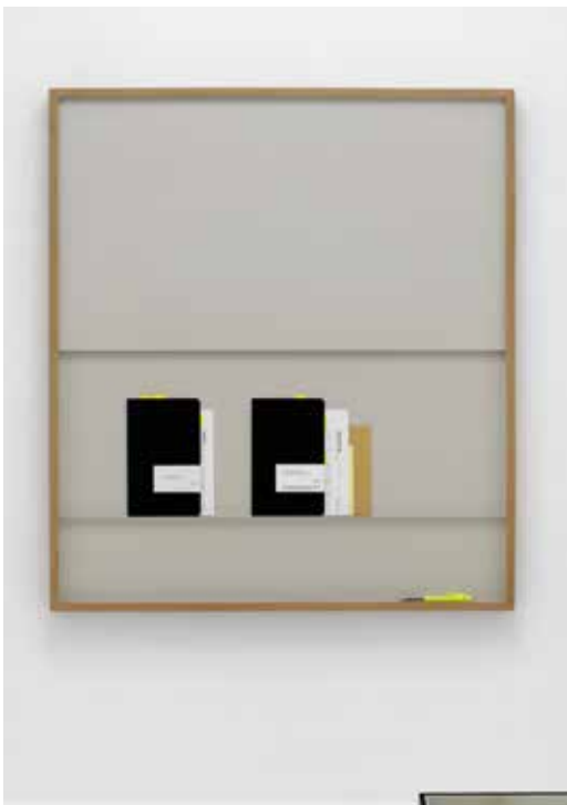
Wesley Meuris, Invoice, 2021 Carnets, papier, post-it et trombones assemblés, stylo 92 x 82 cm © Courtesy Galerie Poggi © Aurélien Môle