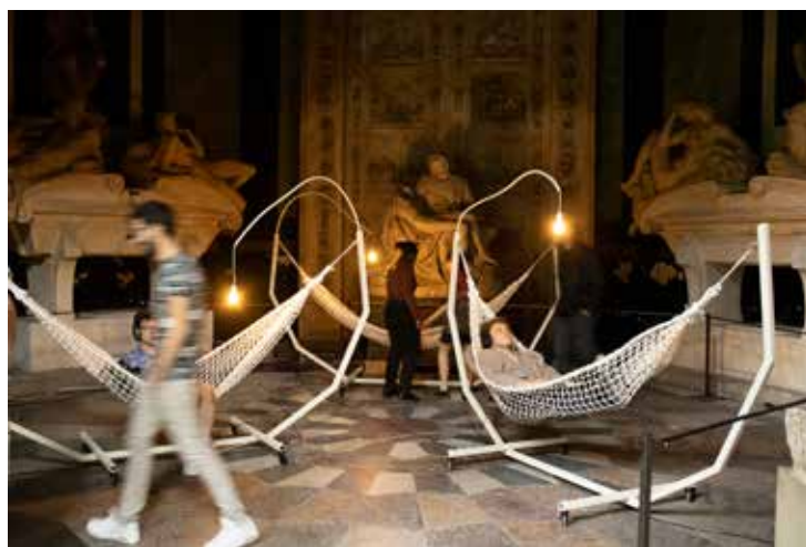
Isadora Soares Belletti, Gloop Splash Blup , 2022 Enceintes, casques, métal, filet de pêche, lampe, fil électrique, dimensions variables