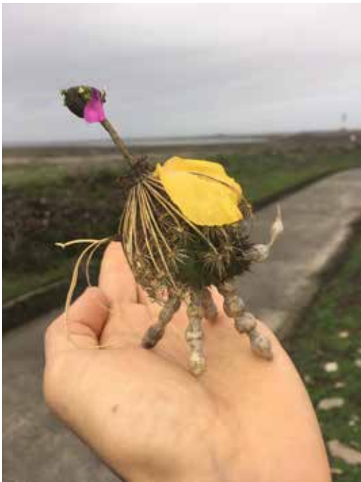
Mathis Perron, Fée, Ile de Sein, Bretagne, 2022 Photographie d'assemblage végétal