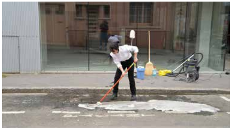
Qingmei Yao, One Hour Occupy Parking Art, 2015 (détail) Archive, installation