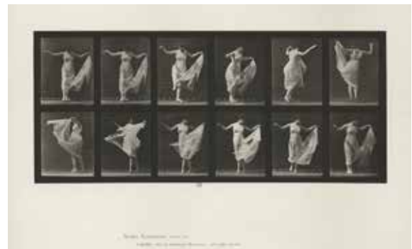
Eadweard Muybridge, Femme drapée dansant dans Animal locomotion, pl. 187, 1872-1885 Phototypie