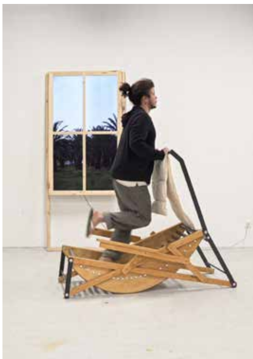
Gabriel Moraes Aquino, FFEJ , 2022 et Sol Ardente , 2022 Installation/ensemble