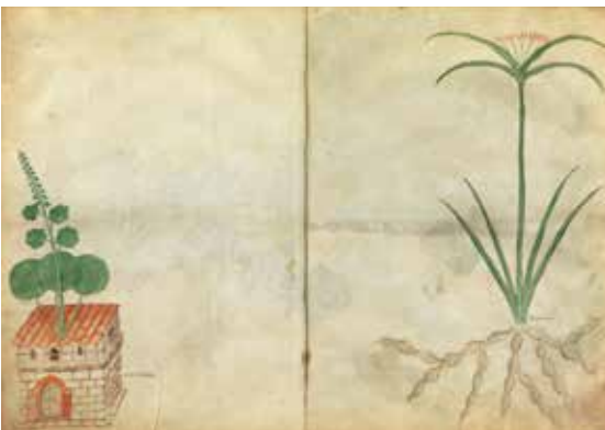
Anonyme, Tractatus de herbis, 1370-1380 Encre sur parchemin