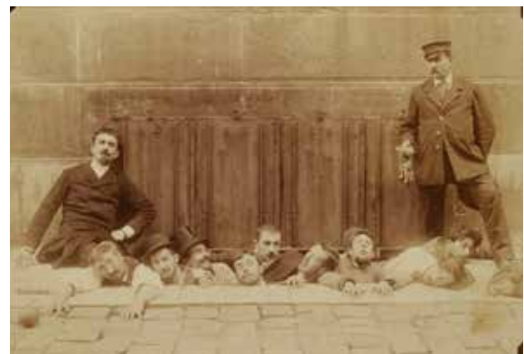
Anonyme, Dix logistes et un surveillant à l'École des Beaux-Arts , 1888 Épreuve sur papier albuminé © Beaux-Arts de Paris © Jean-Michel Lapellerie