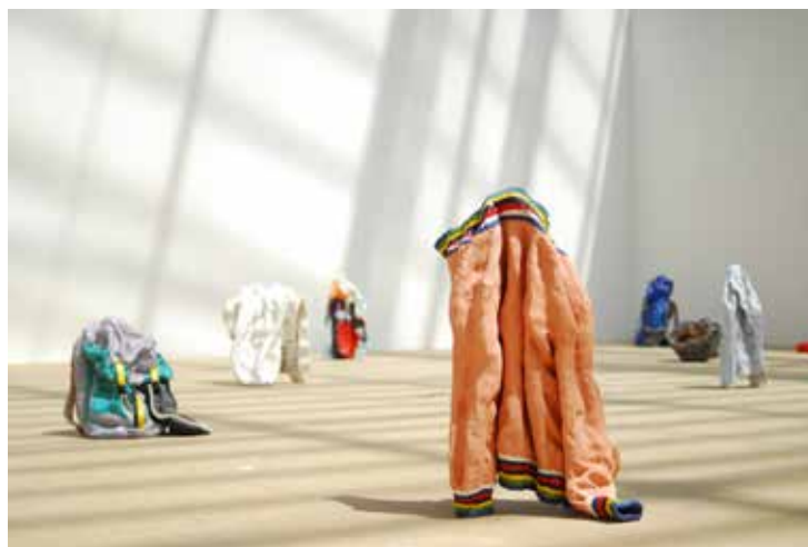
Ninon Hivert, Personne.s , 2021 Installation de céramiques, dimensions variables