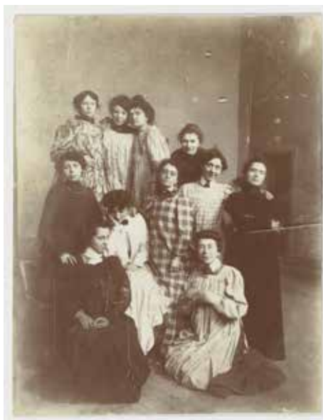
Anonyme, Atelier de femmes à l'École des Beaux-Arts, vers 1903, artistotype © Beaux-Arts de Paris © Jean-Michel Lapellerie