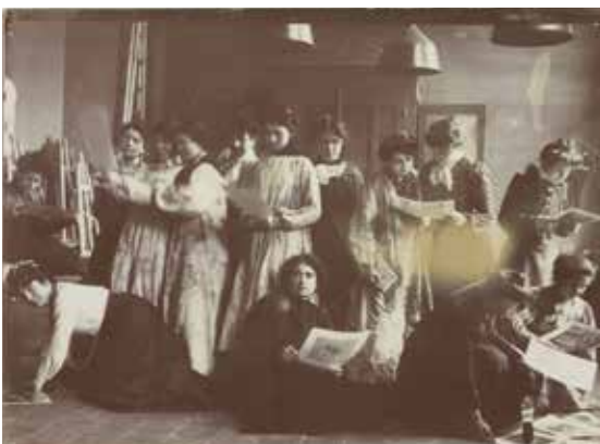
Anonyme, Atelier de femmes à l'École des Beaux-Arts , vers 1903, épreuve argentique