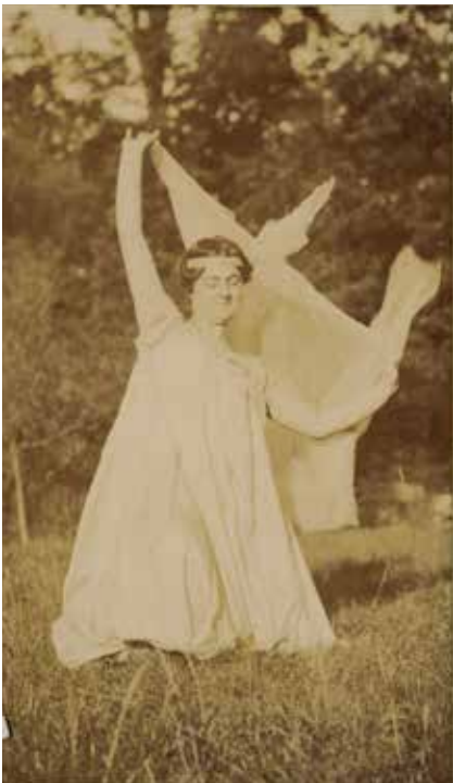
Anonyme, Danseuse imitant la danse de Loïe Fuller , XIX e siècle Épreuve sur papier albuminé © Beaux-Arts de Paris © Jean-Michel Lapellerie