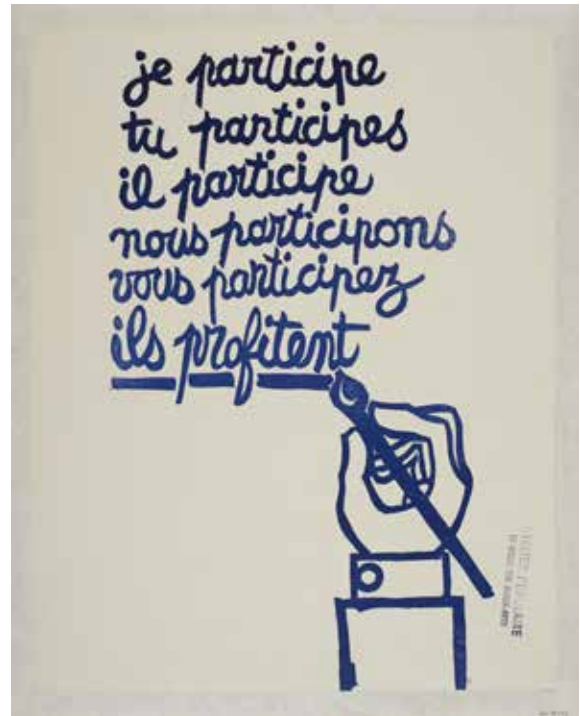
Anonyme, Je participe , 1968 Sérigraphie, affiche, impression en bleu © Beaux-Arts de Paris © Thierry Ollivier