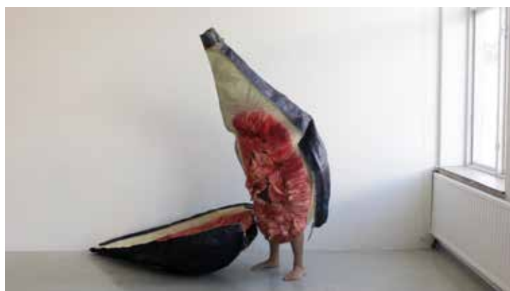
Ingela Ihrman, One Fig , performance documentation, 2021