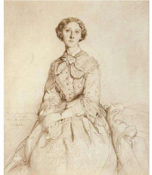
Princesse Cantacuzène, épouse de Puvis de Chavannes – Musée du Louvre