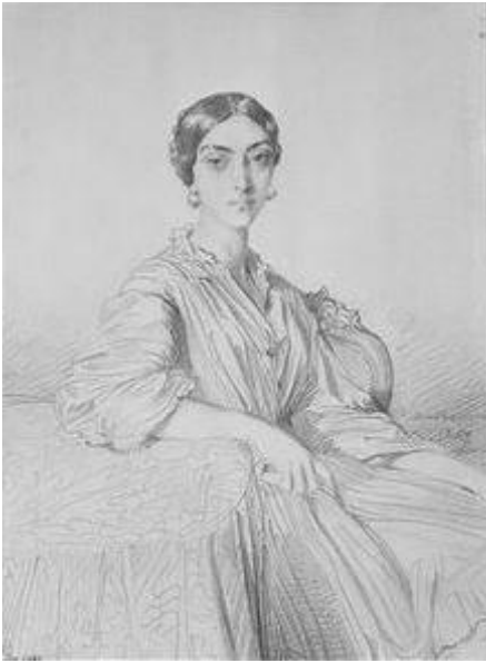
Princesse Belgiojoso - Petit Palais