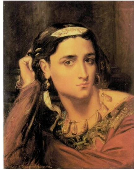
L'actrice Rachel - Musée des Beaux-Arts, Alger