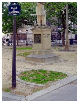
Place du Guatemala