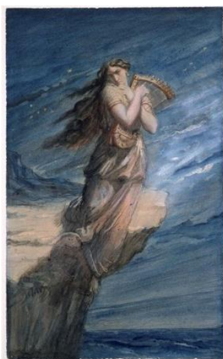
Sapho - Louvre