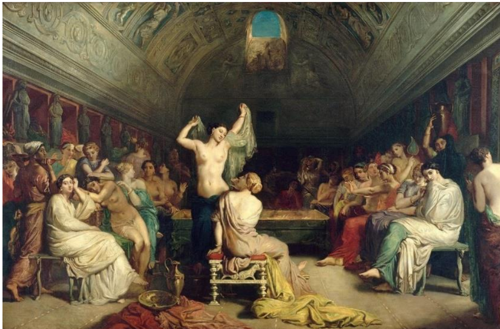
Le Tepidarium - Musée d'Orsay