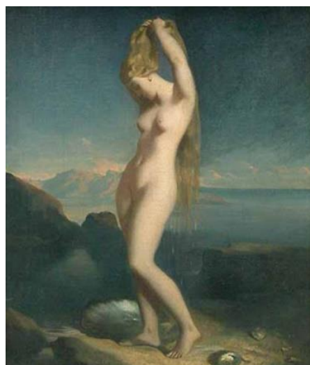
Vénus anadyomène - Louvre