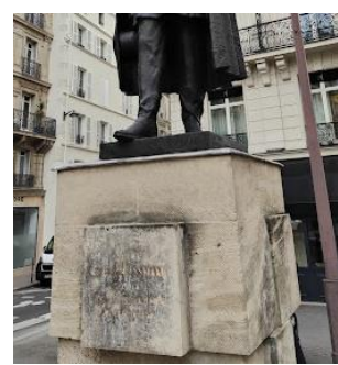
133 rue de Laborde