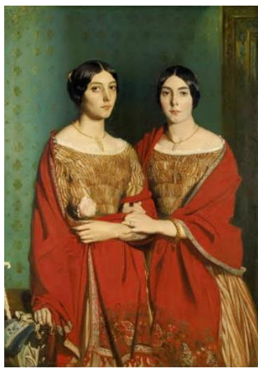
Les deux sœurs - Louvre