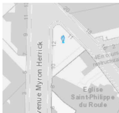
Emplacement prévu pour la sculpture