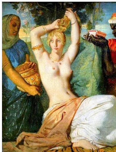
Esther - Louvre