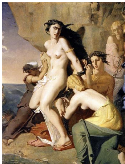
Andromède - Louvre