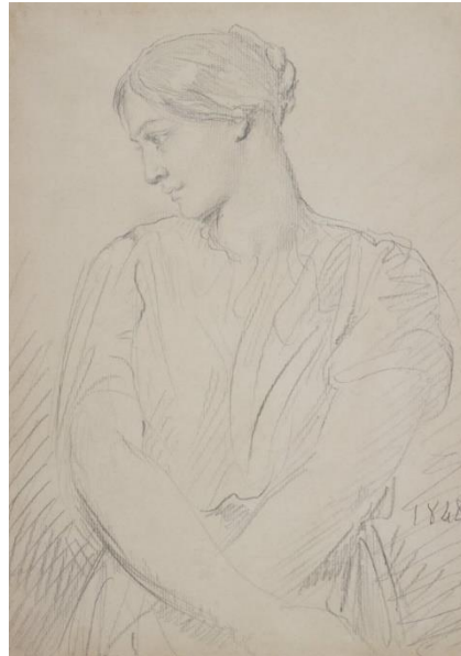
L'actrice Alice Ozy – Musée Carnavalet