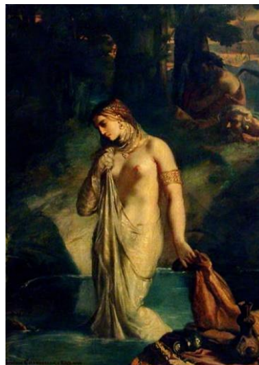
Suzanne - Louvre