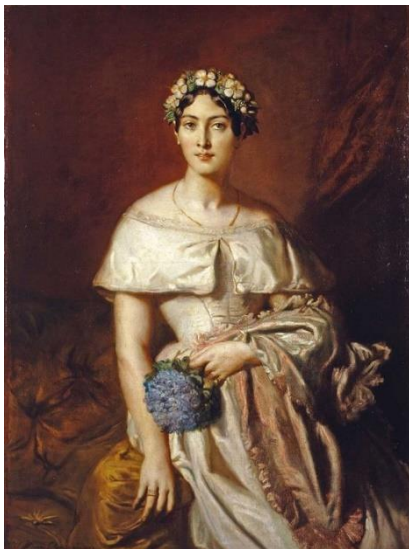
Mademoiselle de Cabarrus – Musée de Quimper