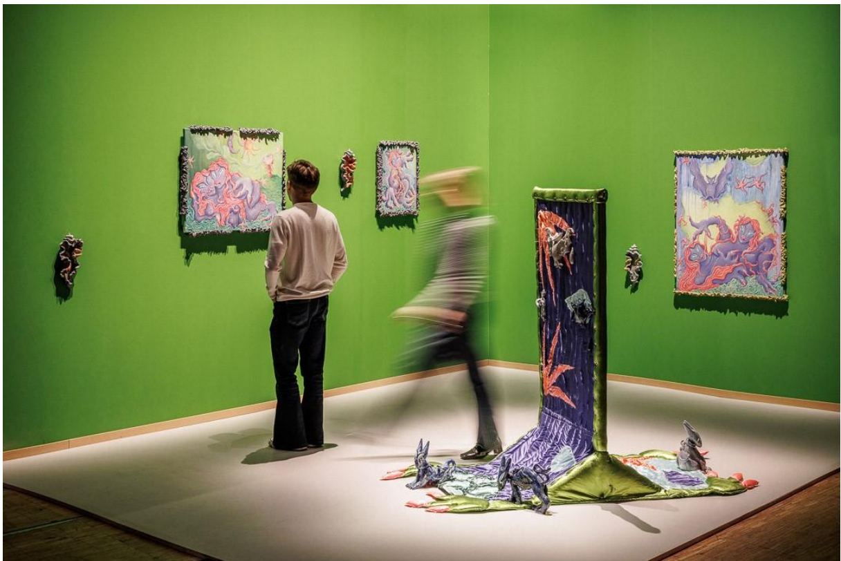
Opale MIRMAN, Spiritus familiaris , 2023, 100% L'EXPO 2024, La Villette, 11h45