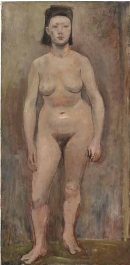
Ellsworth Kelly, Nude , 1949 Huile sur toile