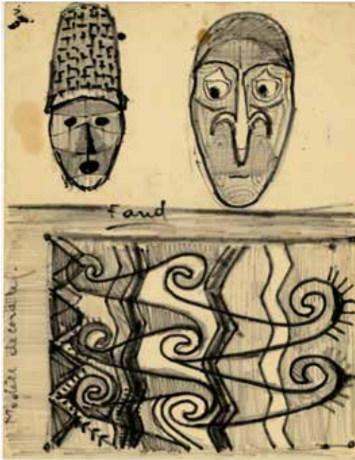
Farid Belkhaia, Modèle décoratif , 1958 Feutre sur papier