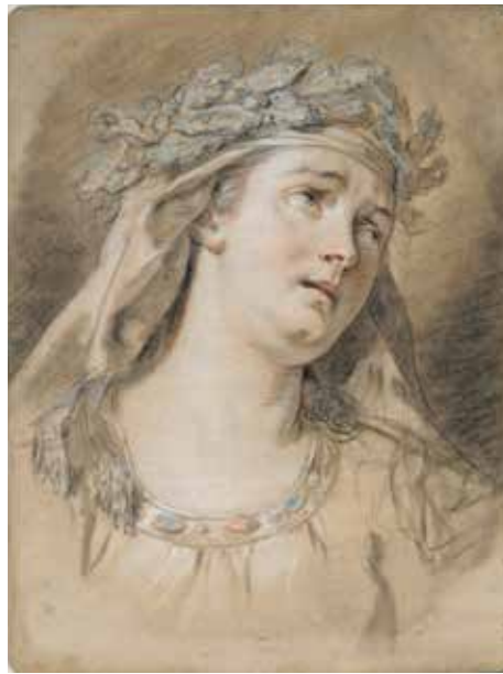
Jacques-Louis David, La Douleur , 1773 Pastel, 53,5 cm x 41 cm