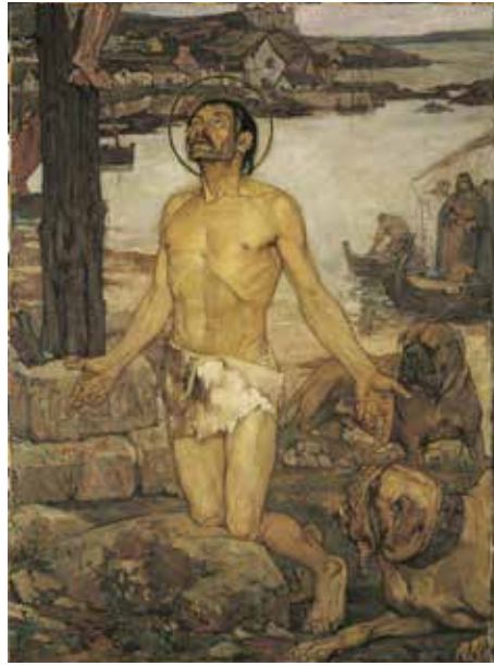
Odette Pauvert, La légende de Saint Ronan , 1925 Huile sur toile © Beaux-Arts de Paris