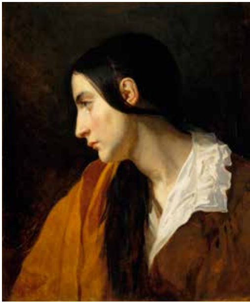
Thomas Couture, La mélancolie , 1835 Huile sur toile, 55 x 46 cm, Paris