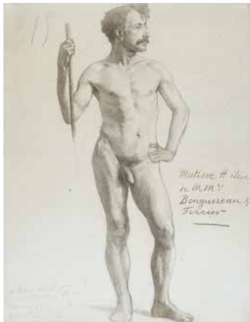
Henri Matisse, Nu debout , 1892 Fusain sur papier © Succession Henri Matisse