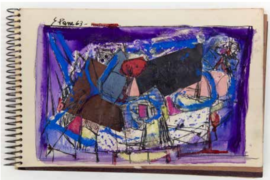
Gina Pane, Carnet « lavis-aquarelle » , 1963 © Gina Pane, ADAGP, Paris, 2024