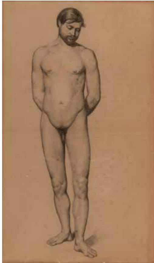
Paul Cézanne, Académie d'homme nu, 1862 Mine de plomb