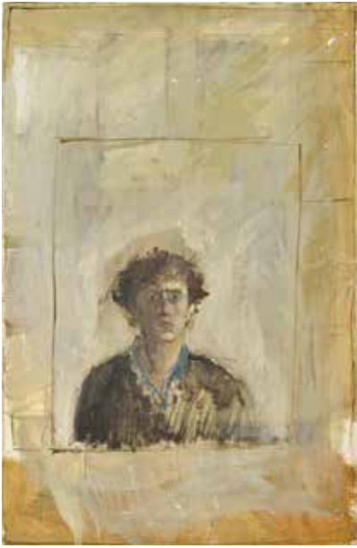
Hélène Delprat, Autoportrait , 1976 Acrylique sur toile © Courtesy Hélène Delprat et Galerie Christophe Gaillard © Rebecca Fanuele