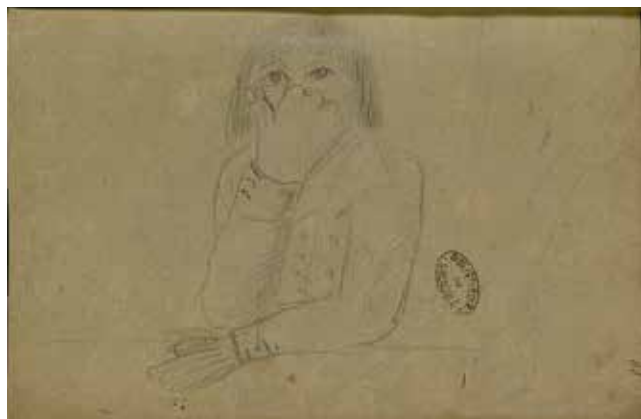
Stendhal, Autoportrait de Stendhal in « Recueil factice des œuvres diverses de Henry Beyle, dit Stendhal. Volume 26 » , 1798, papier, Inv. R. 5896 Rés., volume 26, feuillet 63, recto