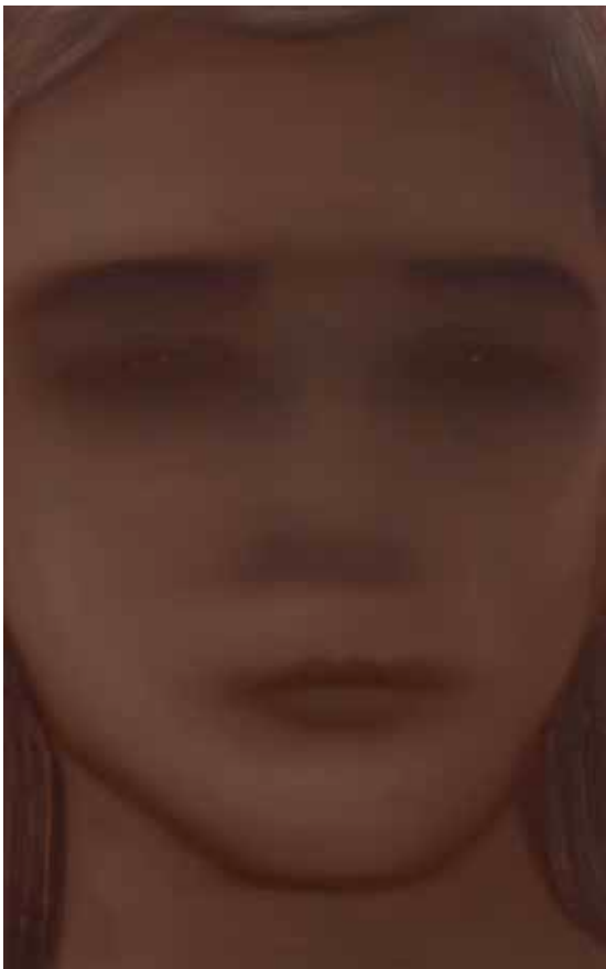
Julien Heintz, The daughter , 2023 huile sur toile, 116x80cm