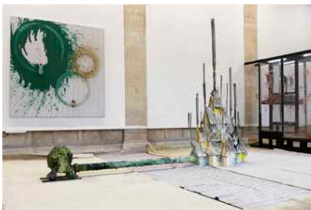
Thomas Buswell, vue du diplôme Juggle eggshells in a plastic jungle , 27 mai 2024, matériaux multiples et dimensions variables © Simon Petit Fort et Hélène Janicot