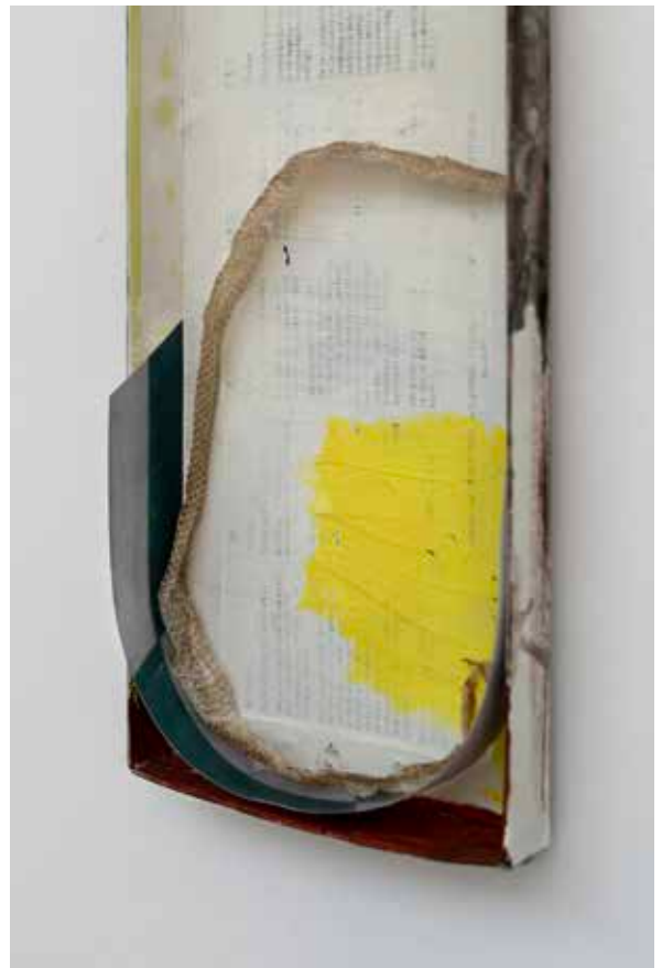
H el ene Janicot, After sun, mue de serpent , acrylique sur carton, image imprim ee, 2024