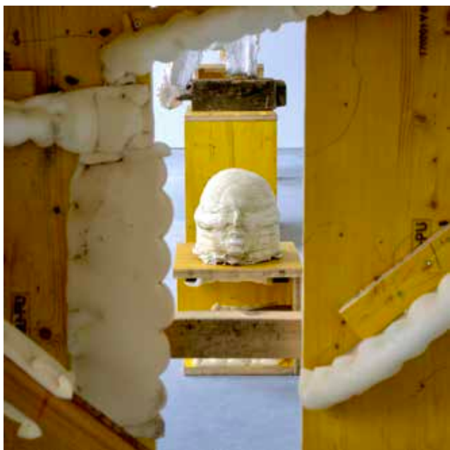
Gilad Ashery, Zzzz , 2024 mixed media, 60 x 30 x 30 cm