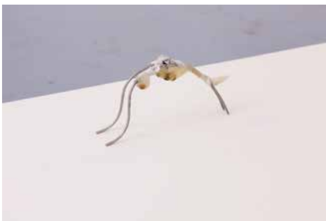
Anna de Castro Barbosa, Spéculum II , 2024, inox, verre, gaze, tarlatane, graisse, bande médicale, 27cm x 14cm