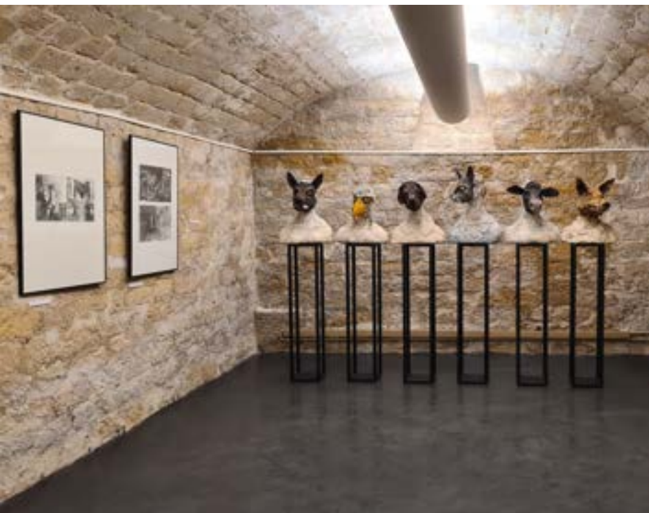
Salle 6 ( Bothuon, Hristova )