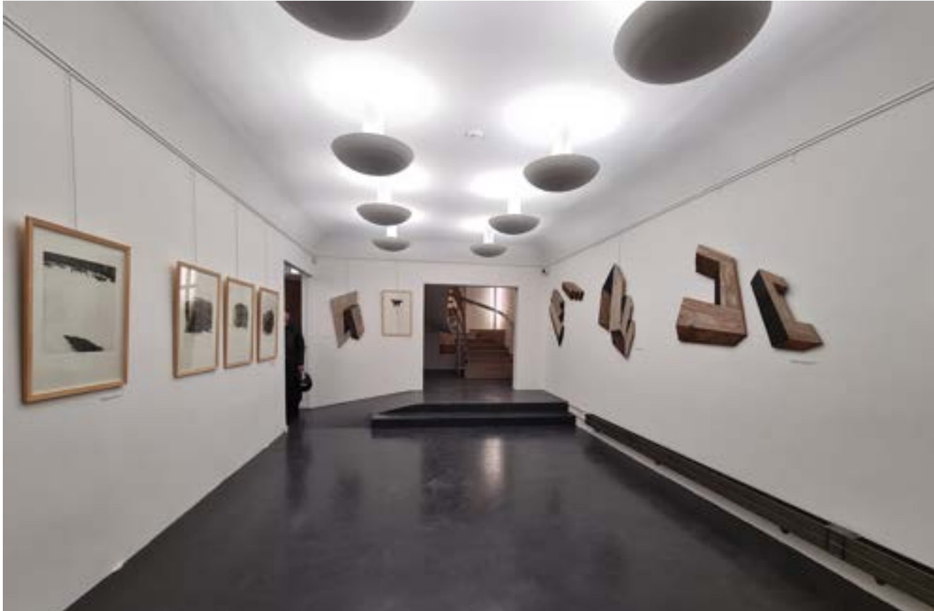
Salle 2 ( Gillet, Driessens )