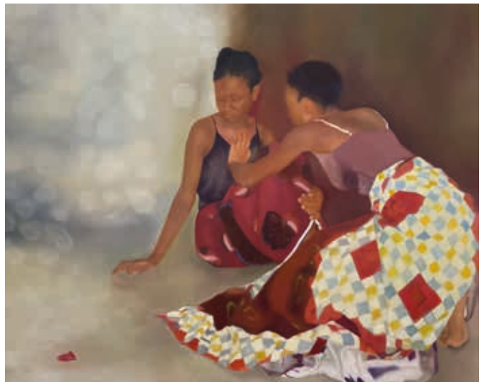
Océane Maria Adjovi, L'origine de nos actes , 2024 Huile sur toile, 162 x 130 cm