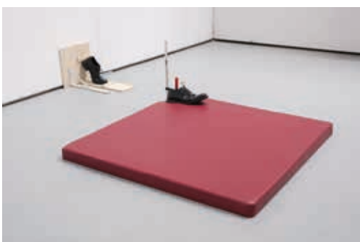
Romain Pommelet, En marche , 2023, chaussures, équerre en métal, simili-cuir, mousse, serre-joints, contreplaqué, dimensions variables