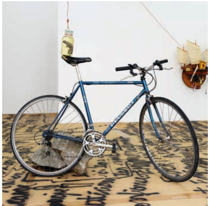
Jonathan Potana, Mouvement Primaire , Centre d'Art Ygrec - ENSAPC, 2024 Caméléon dans le formole suspendu avec fil de cuivre sur vélo et pierres, 5 x 1,3 m © Objet Pointus