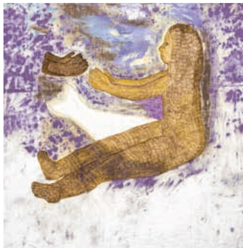
Fanny Irina, Offrande , 2023 Peinture à l'huile et pastels sur toile, 86 x 86 cm