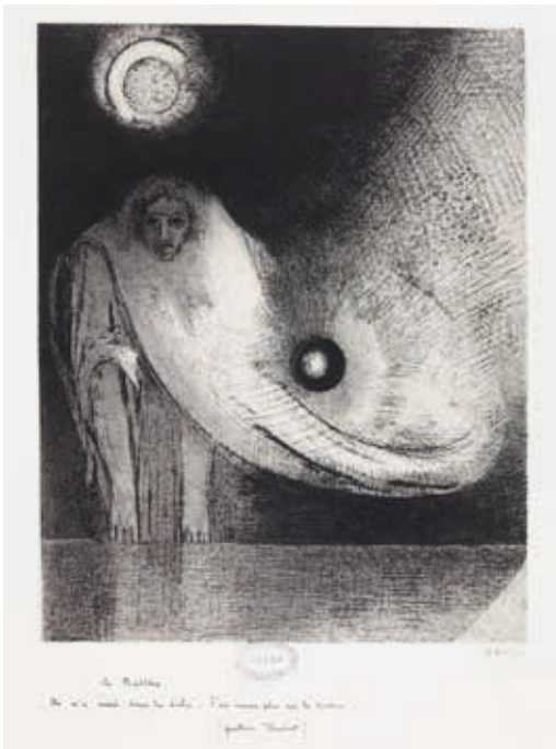
Odilon Redon, Le Buddha , 1895 Lithographie sur chine appliqué, 60 x 42,5 cm