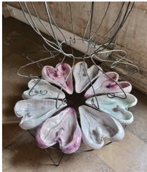
Yue Yu, ((, )) entre 8188 lèvres depuis 400 ans Grès émaillé, émaux de cendres (chêne, charme, hêtre, bouleau, sapin et frêne), acier forgé, 1,20m x 1,20m x 2,50m