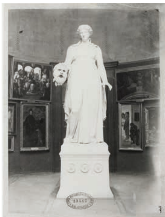
Petit Pierre, Statue de la Melpomène