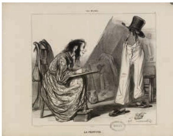
Guillaume-Sulpice Gavarni dit Paul, La Peinture, 1839

Feutre et aérosol sur carton, 78 x 97 cm