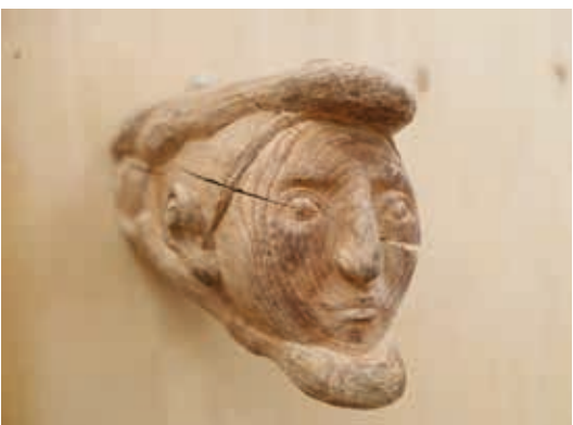
Shengqi Kong, Crocodile boy , 2022 Chêne, 16 x 16 x 28 cm © ©ADAGP Paris 2025, Shengqi Kong