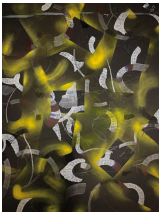
Akshay Rathore, White thing creeping in black 02, 2022

Feutre et aérosol sur carton, 78 x 97 cm