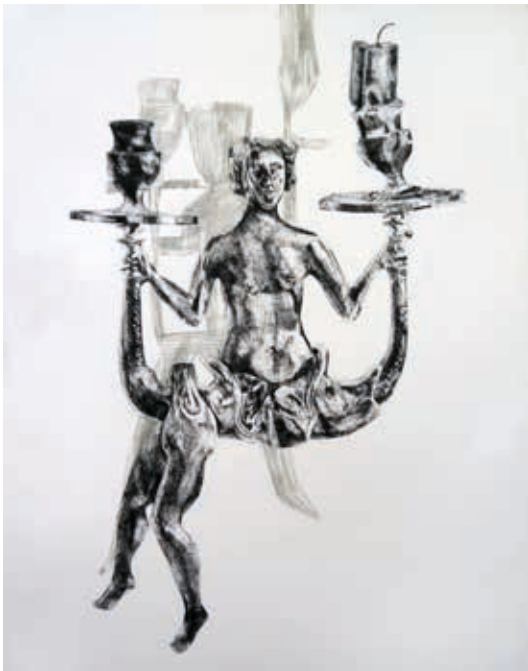
Frédérique Loutz, sans titre , 2019 Encre de chine et crayon de couleur, 170 x 135 cm