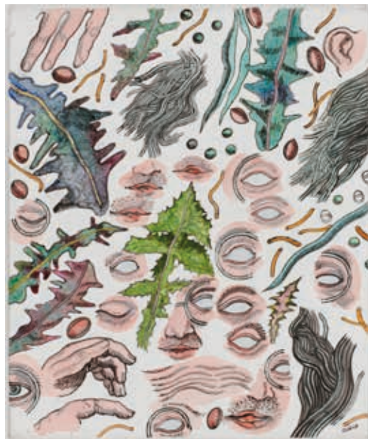
Henri Cueco, Autoportrait aux feuilles de pissenlit , 2002 Acrylique sur toile, 55,3 x 46,5 cm