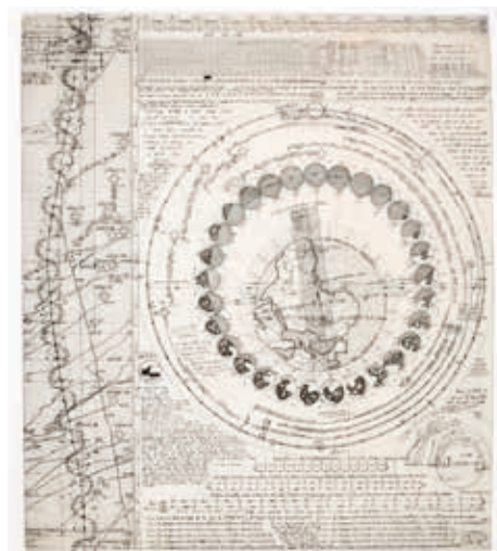
Roger Hardy, Sans titre , non daté Encre de Chine sur calque