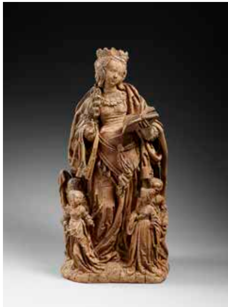
Anonyme, Sainte-Ursule et quatre vierges martyres, v. 1500-1510, bois polychrome, 37 x 72,5 x 24 cm