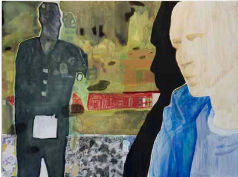
Amalia Khalifa, Quand les cendres s'envolent , 2025, huile sur toile, 130 x 195 cm