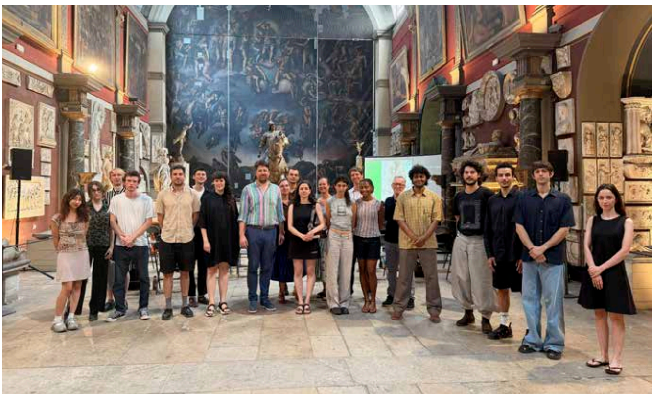
Lauréates et lauréats des Prix des Fondations 2026