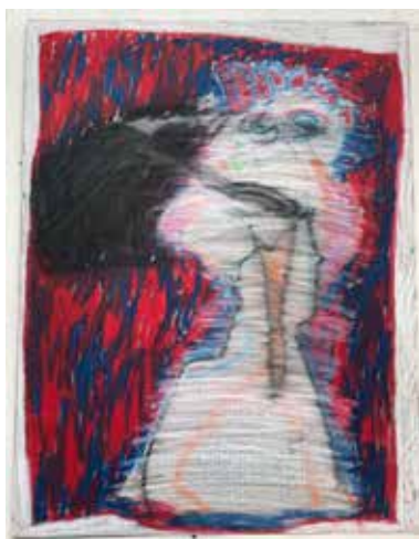
Marko Kolomytskyi, La mouche , pastel à l'huile et fusain sur papier, 55 x 66 cm