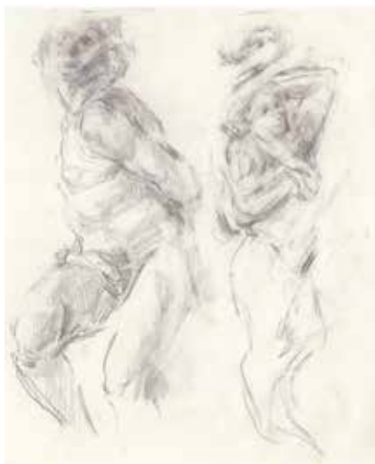
Carmilla Delmas, sans titre, détail, 2026, graphite, 20,3 x 26,5 cm