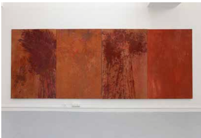
Louise Glévéau Guerreiro, Arbres , 2025, technique mixte, 195 x 520 cm