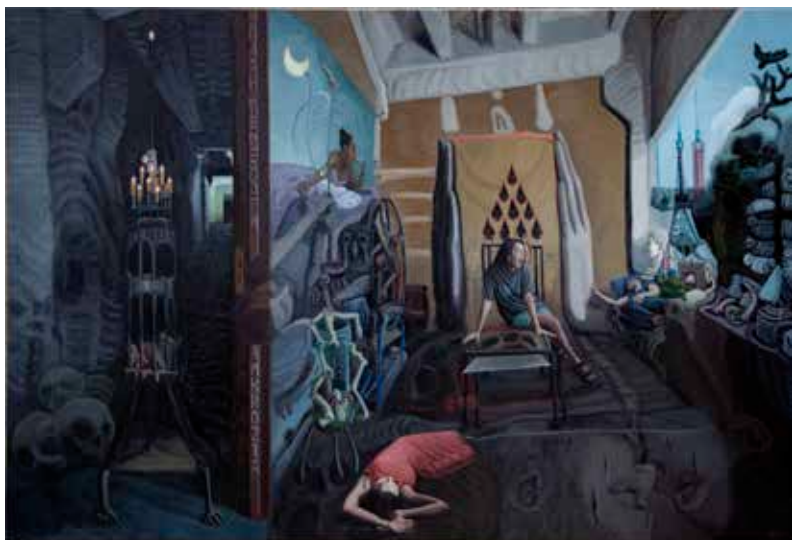
Margarita Sherstiuk, Le plan de victoire , 2024, huile sur toile, 130x195 cm