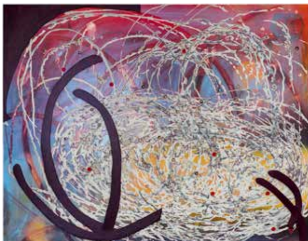
Rose Ras, Setsubun , 2025, technique mixte sur bois, 151,5 x 198 cm