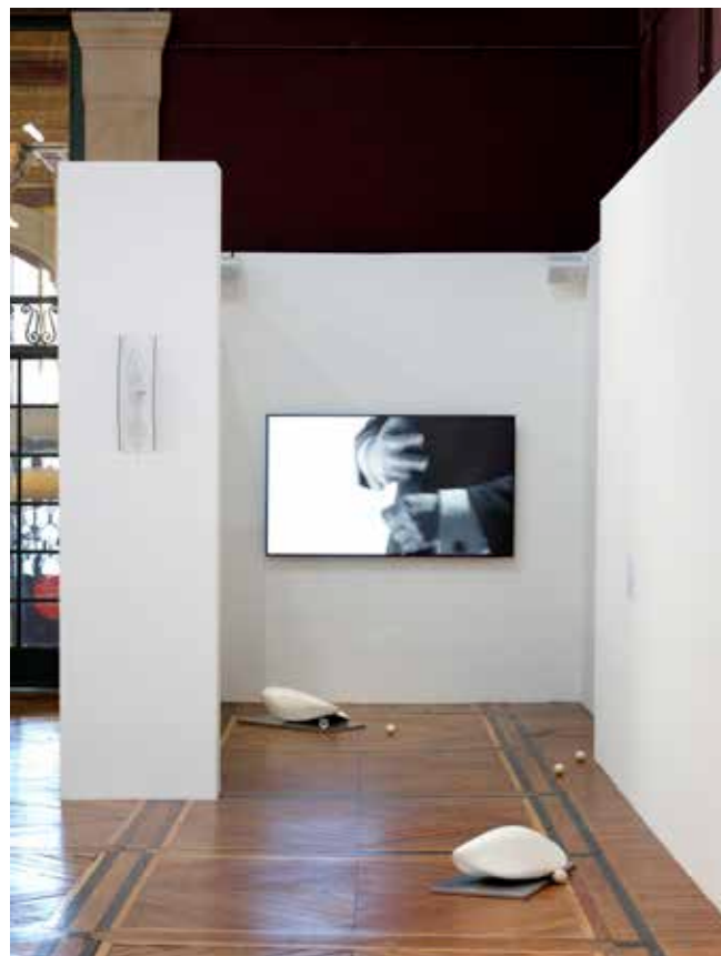
Marine Ducroux-Gazio, The Rainmaker I (Le Magicien) , vue de Felicità, Palais des Beaux-Arts, 2026, boucle vidéo 4k, 7 min