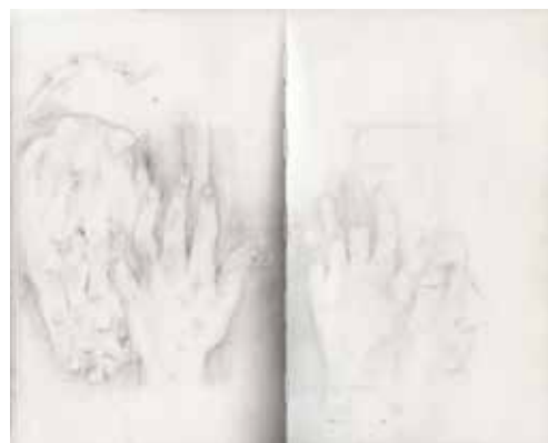
Emma Fernandez, sans titre (vue de carnet), Musée du Moulage, 2025, graphite, 20,5 x 25 cm