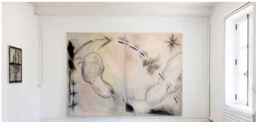
Lea Gattoni, Moi aussi j'oublie , 2024, fusain, huile sur toile, dyptique de 230 x 190 cm

Lea GATTONI , diplômée 2025, Prix Maurice Colin-Lefranc, peinture (5 000 €)