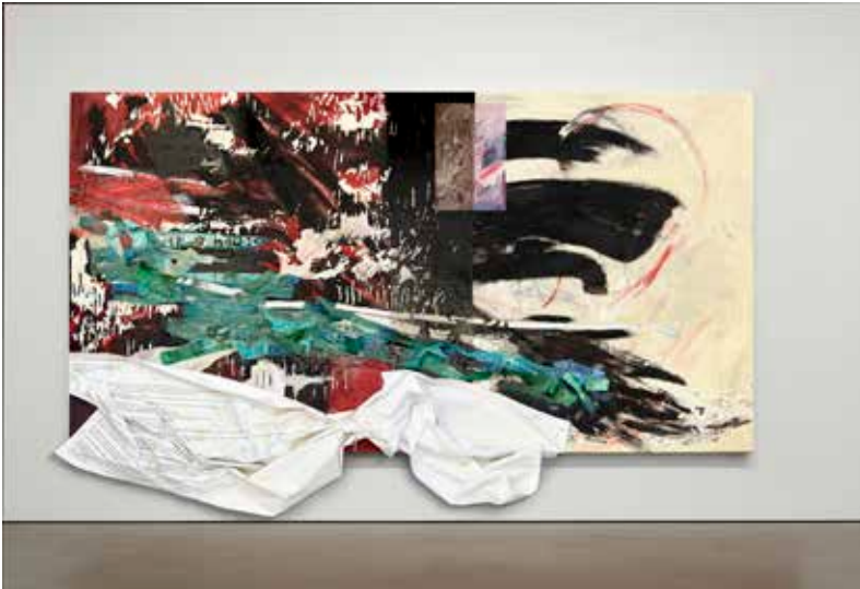
Cily Gonzalez, Smiling with blood between my teeth , 2025, huile, papier, chaux, pigments, poudre de marbre, sables, goudron, résine de dammar sur bois, 153 x 300 cm