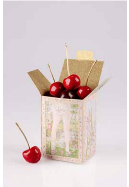
Mathieu Santori-Lamberti, Le temps des cerises , 2026, crayon sur papier, céramique et laiton, 5 x 12 x 4 cm