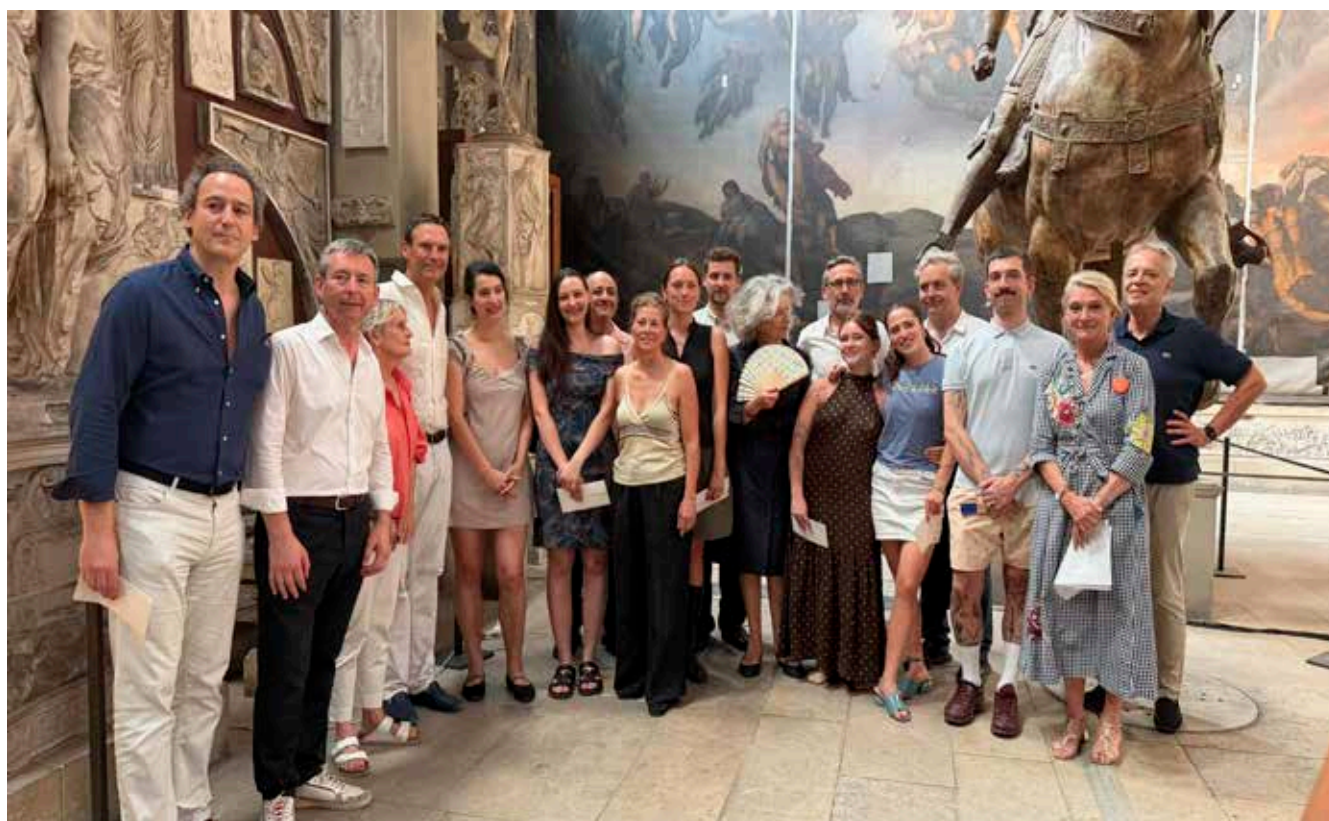
Lauréates et lauréats des Prix des Amis des Beaux-Arts de Paris 2026

Depuis 2008, ces prix sont destinés à aider financièrement des élèves des Beaux-Arts de Paris et à faciliter leur passage vers la vie professionnelle. À l'exception du prix du Portrait ouvert à tous et toutes, ils sont réservés aux élèves de 3 e et 5 e année.