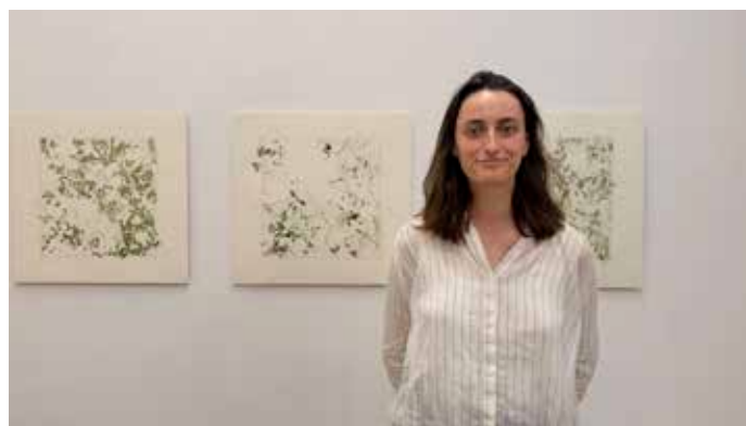
Jeanne Bastien, Reconnaitre , 2025, crayon de couleur et graphite sur papier, 65 x 68,5 cm