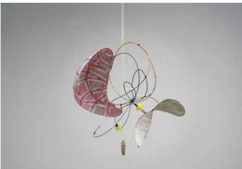
Alexandra Willis, Sitting duck , 2025, techniques mixtes, 176 x 60 x 60 cm